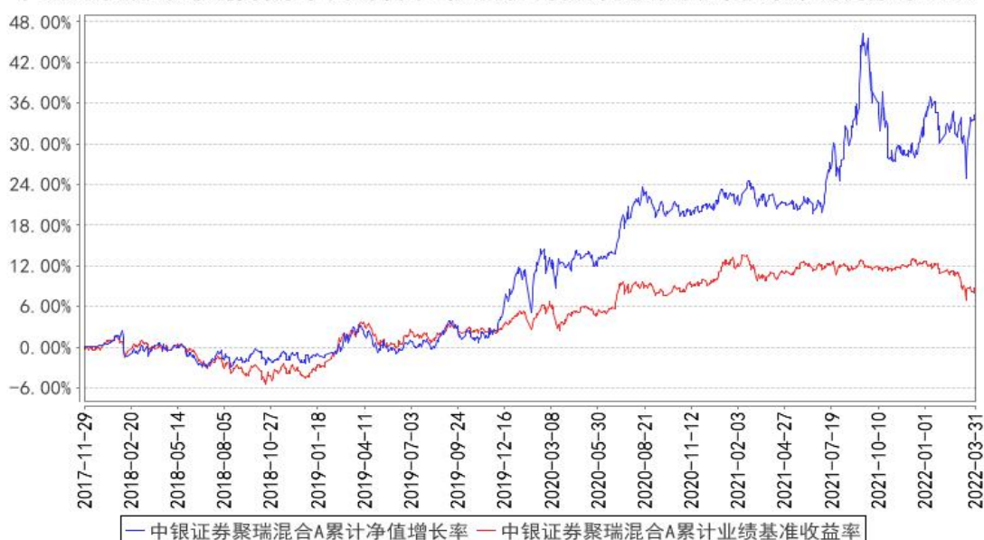
中银证券聚瑞混合A累计净值增长率与同期业绩比较基准收益率的历史走势对比图