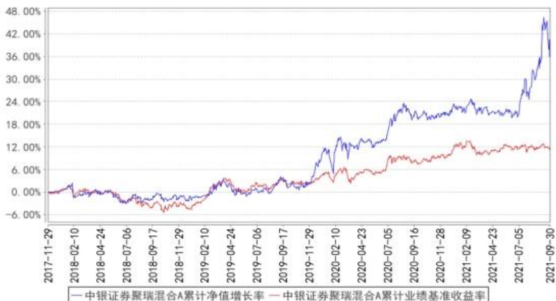
中银证券聚瑞混合A累计净值增长率与同期业绩比较基准收益率的历史走势对比图

2、自基金合同生效以来基金累计净值增长率变动及其与同期业绩比较基准收益率变动的比较